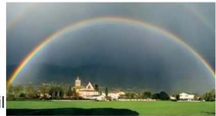
Meravigliosa Terra Umbra Iris Valorosi

“Vivere la realtà con i sensi” è un progetto interdisciplinare di educazione civica per tutte le scuole di ogni ordine e grado. Al centro del progetto c'è il libro fotografico “Meravigliosa Terra Umbra” di Iris Valorosi , un libro fatto di immagini, parole e musica, in sintonia con il “Cantico delle Creature” di San Francesco al quale il volume stesso è ispirato.